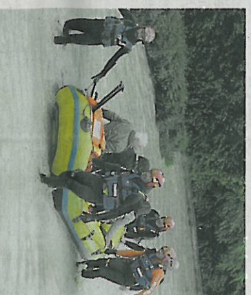
Alcune persone portate in salvo con un gommone