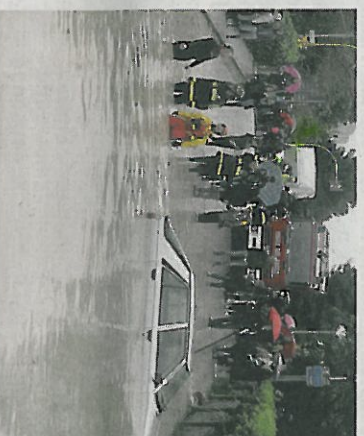
Il ponte del Portone con tanta gente in attesa