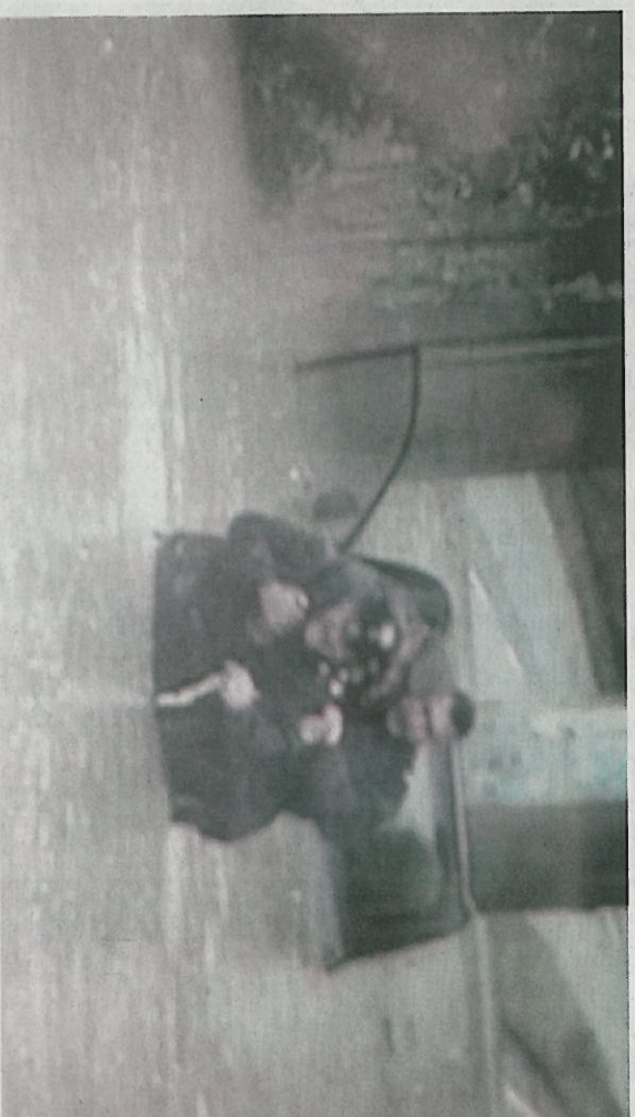
I carabinieri di Jesi portano in salvo l'anziano

“A difficoltà - raccontano i carabinieri di Jesi - era dovuta al fatto che l'auto era in preda alle acque e quindi si muoveva in balia della corrente. Il rischio per i militari è stato quello di finire schiacciati dall'auto o che il veicolo stesso si inoltrasse contro i pilastri del sotto-