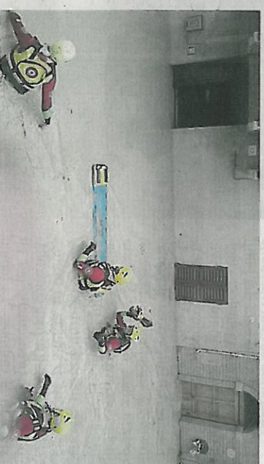
In alto la forza del Misa a Senigallia e poi i soccorritori al lavoro