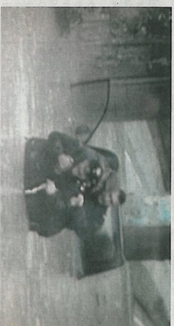
I carabinieri di Jesi soccorrono un anziano prigioniero dell'auto sommersa

Operazione antidroga della Squadra mobile Cocaina Vip da Roma Due giovani in manette