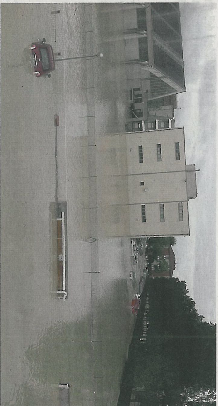
Il campus scolastico di via Capanna semi-sommerso dall'esondazione del fiume Misa