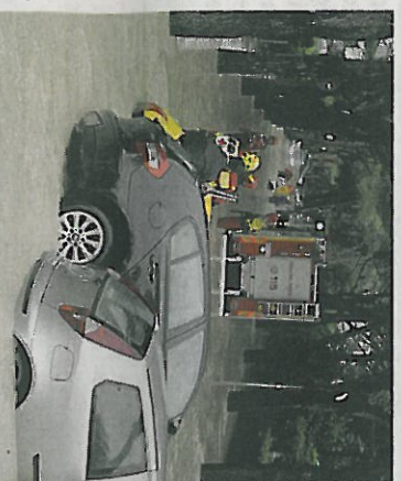
I vigili del fuoco in un viale alberato