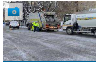
Burian nelle Marche: neve a Cingoli