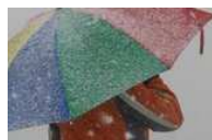
Meteo, arriva il gelo del Burian freddo al Nord, neve al...