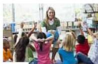
Partner Gli studenti mettono i voti ai prof... la riforma della scuola (Bravi Bimbi)