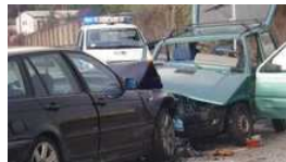
Le consegnano la salma del padre ma sono spariti soldi e fede d'oro