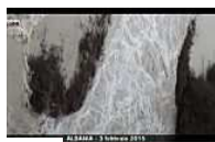
Partner Turchia disagi maltempo: forti piogge, venti fino a... (Sky)