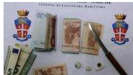
Arrestata spacciatrice Vendeva droga al Sert di Ancona