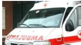
Anziano investito da un'auto Paura e soccorsi in centro