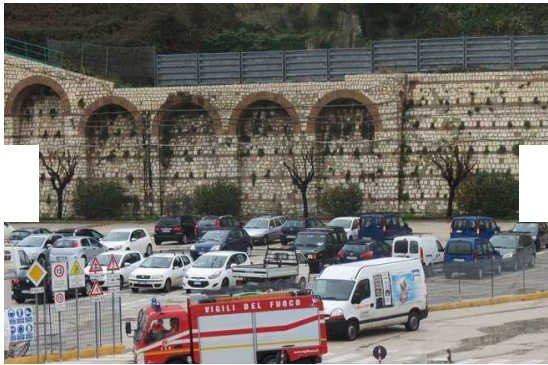
Marche, incubo maltempo

Le piogge si sono spostate verso Sud Est, dando una tregua alle località costiere più colpite. A Senigallia, dov'era scattato l'allarme pre alluvione, le scuole sono state riaperte. Si lavora per prosciugare i sottopassi del lungomare anche a Marina di Montemarciano e Falconara e si contano i danni fatti dalle mareggiate alle strutture balneari e alle spiagge.