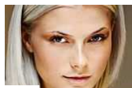
Partner Come portare i capelli bianchi (Donnamoderna)