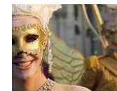
Carnevale romano, al via la VII edizione: si celebra la regina di Svezia