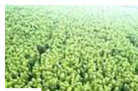
Partner Indonesia, prodotti forestali sostenibili (asiapulp.com)