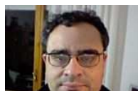
Ancora nessuna traccia dell'operaio scomparso