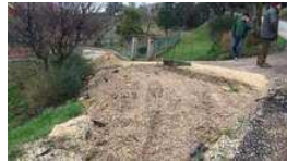
Cede il terreno, bus sospeso nel vuoto Autista salvato dai vigili del fuoco

Altri danni nelle frazioni dove ci sono stati smottamenti, alberi caduti in strada, allagamenti e voragini. Osservata speciale è la grande frana di Posatora, controllata dai geologici del Comune. A Marina Dorica il mare ha allagato proprio una delle cabine di monitoraggio, ma il controllo dell'area era comunque garantito. Danneggiate anche le strutture del ristorante La Vecchia Pesca, una palafitta sul mare in zona Barducci che non ha retto l'urto delle onde.