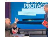
Giletti litiga con Capanna per i vitalizi e si infuria