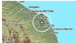
Scossa di terremoto di magnitudo 2.4 Brivido tra Osimano e Maceratese